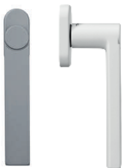
Poignée de fenêtre ronde avec rosette standard

Les poignées SELECTION sont disponibles avec des rosettes de 27x10mm ou 33x14mm en fonction du type et des dimensions de la menuiserie. Une rosette réduite (disponible en 2022) accentuera le style minimaliste.