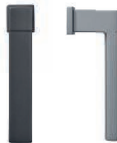
Poignée de fenêtre carrée avec rosette format réduit *