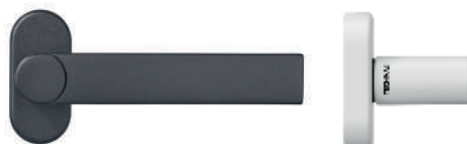
Poignée de porte avec rosette spécifique (33x14mm) (uniquement disponible en version ronde)